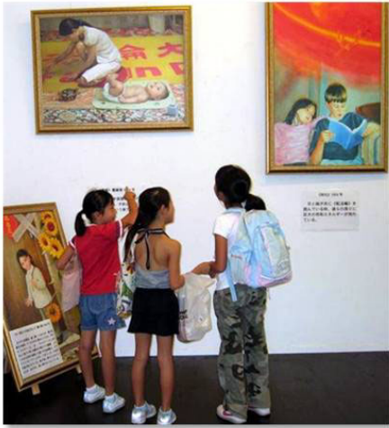
日本小学生观看法轮功学员作品

【明慧网】二零零七年九月二十一日至二十六日，日本第十一届“真善忍美展”在仙台举行，前来参观的民众络绎不绝，许多人在了解了法轮功在中国大陆遭受残酷迫害的真相后感到震惊，一位老奶奶看到真实再现法轮功学员遭受酷刑的画作时赞叹：只有真正有崇高信仰的人才能有这样大义凛然、不屈不挠的精神。