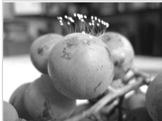
二零零七年七月在中国大陆发现的长在葡萄上的优昙婆罗花

近期，中国大陆各地陆续出现“优昙婆罗花”的盛开，从寺院到寻常百姓家，令人备感佛恩。信神佛者更坚定信念，无神论者也该默然思量。人世间每件大事的发生，都对应着天象，是天象变化的反映。“种瓜得瓜，种豆得豆”，因果报应不论人是否相信，也不管其身份贵贱，都一视同仁，毫厘不差。