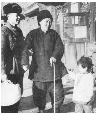
▲ 扶老携幼,还有随身摄影师跟随抓拍精彩瞬间,真是“好人”有“好事”啊。

光,你是否照亮了一分黑暗?”,这是散文吗?不是。“人的生命是有限的,可是,为人民服务是无限的,我要把有限的生命,投入到无限的为人民服务之中去。”这是哲学家的