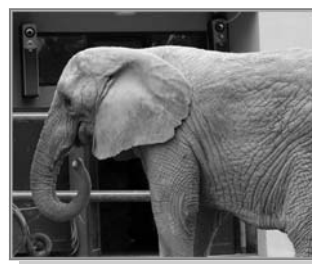
▲ 2006年7月3日,克罗地亚动物园内大象Suma在听莫扎特音乐。当同伴死后,Suma

中国作为音乐治疗的发祥地之一,先民们早就探索宇宙规律与生命节奏的秘密,如“天有五音,人有五脏;天有六律,人有六腑。此人之与天地相应也”;“音乐者,所以动荡血脉,通流精神和正心也”;“去忧莫若乐”;“听曲消愁,有胜于服药者也”。而音乐之所以有这样的疗效,是因为真正的音乐是赞美天神的,人们从敬畏神灵中所获得的是内心的平静与安宁;真正的音乐是修养身心的,通过音乐人们陶冶性情,节制欲望,提升道德。◇