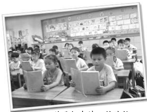
孩子们在读《转法轮》

我是台湾台中县太平小学的老师，今年这一班的学生，是我们一起学习“真、善、忍”的第四年。这三个字，不是口号，不是教条，而是通过身体力行来提升心性的良方。在日常生活中，我用善恶有报、行善积德的故事引导他们，教导他们读法轮功的著作《转法轮》和《洪吟》，讲述其中的法理：做好事会得到白色物质“德”，而做坏事会得黑色物质“业力”，所以做人要说真话、不自私、与人为善、宽容忍让的道理。