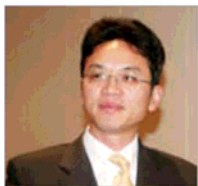
前驻悉尼外交官 陈雨林