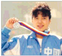
前奥运游泳选手 黄晓敏