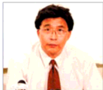
前沈阳市司法局 局长 韩广生