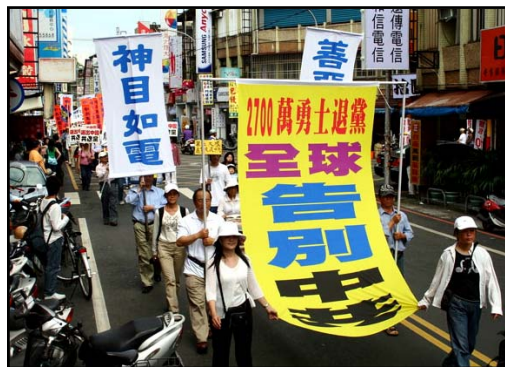
韩国民众声援 2700 万人退党大游行

提示：未开通国际直拨电话的大陆人士打退党电话电话时需用 IP 电话拨打(网通先拨 17969, 电信先拨 17909, 铁通先拨 17991), 手机 IP 电话(“中国移动”先拨 17951, “联通”先拨 17911, 小灵通先拨 17909)