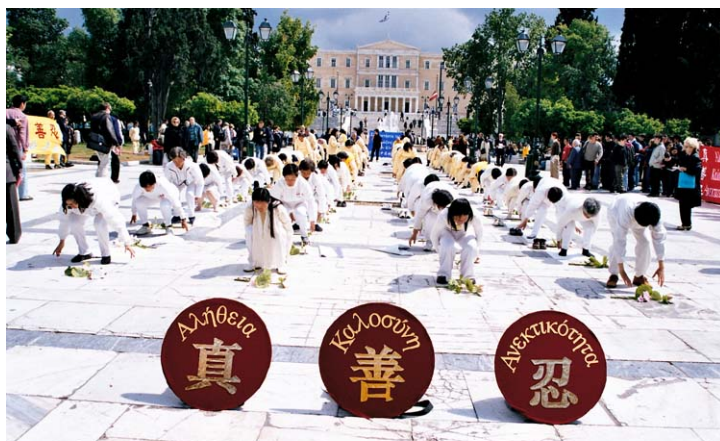
二零零二年海外大法弟子在希腊首都雅典的新达克码的国会大厦广场前集体炼功