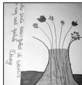
比利时孩子们送给法度的画，表达对法度的同情。

法轮功学员还教给孩子们折莲花，告诉他们莲花在中国代表了一个人的高贵品格，出淤泥而不染，希望这些孩子们能把他们听到的故事告诉更多的人，让更多的人伸出援助之手，制止这场迫害，让更多无辜的孩子再也不要象法度一样受苦。◇