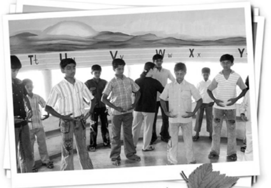
印度 JYOTHI 全校师生一起体验法轮功

业表现普通，甚至有品行不好、很难管教，但自从他们修炼法轮功后，不但坏孩子变好，学生功课普遍大幅