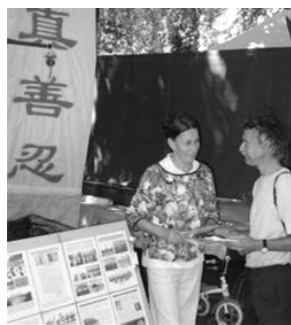
瑞士法轮功真相点

大陆游客们开始平静下来了。这时，大陆旅游团的导游大声说：“请大家都过来，我们到欧洲旅游要注意，要入乡随俗。欧洲有法律规定，发言是自由的，发材料也是自由的。你们可以听，也可以拿材料，你们看了材料，可以印在脑子里，记在心上，材料不带回去，不就行了。不要对人家（指发材料的法轮功学员）那样不好的态度。告诉你们，下一站是法国，也有法轮功学员发材料，你们可要注意了，注意中国人的形象。”◇