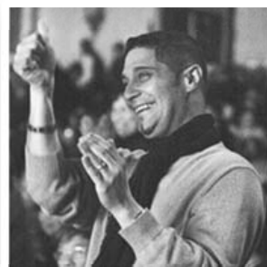
纽约百老汇现场观众

将应各地热邀, 在全球六十余个城市巡回表演, 据神韵艺术团发布资料显示, 预计届时全球将有六十五万现场观众。◇