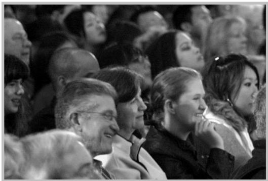
神韵晚会令观众陶醉其中

国际移民基金会主席爱德华先生说，这台晚会是一次真正完美的中国文化之旅，感受到真诚、善良、美好、积极、向上的心境，因此生出对中国传统文化的敬仰。