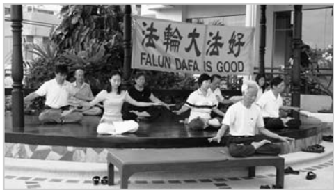
法轮功学员在芭提雅炼功