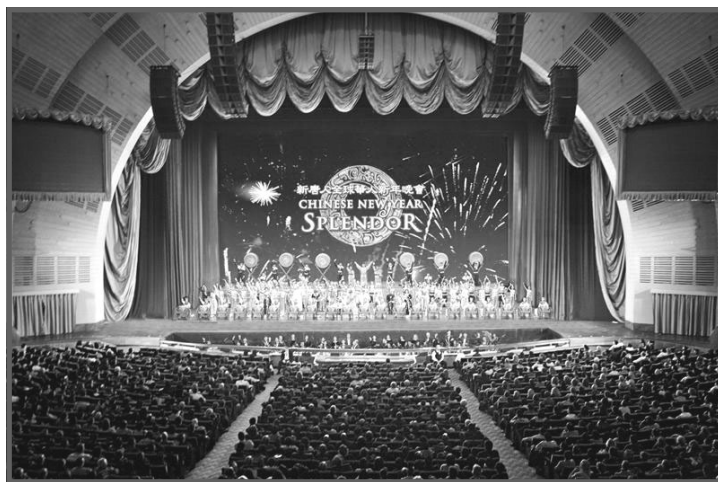
▲全球华人新年晚会纽约主场15场演出从1月30日至2月9日在无线电音乐城隆重上演，图为现场谢幕盛况。

她说，“水平非常好！我觉得超过百老汇的演出，有过之无不及，我刚刚看过Phantom Opera(百老汇演