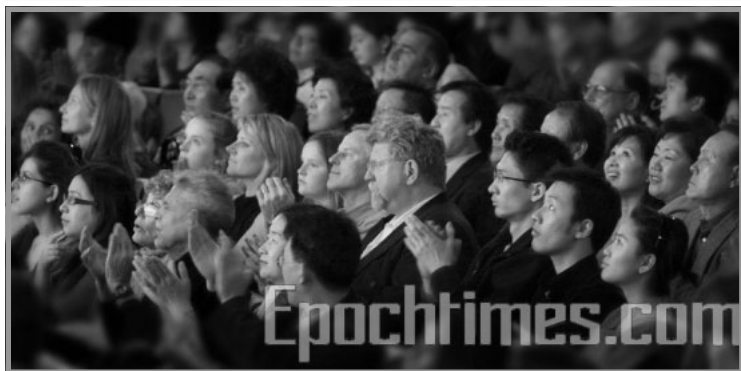
▲2月6日纽约无线电音乐城除夕之夜的现场观众