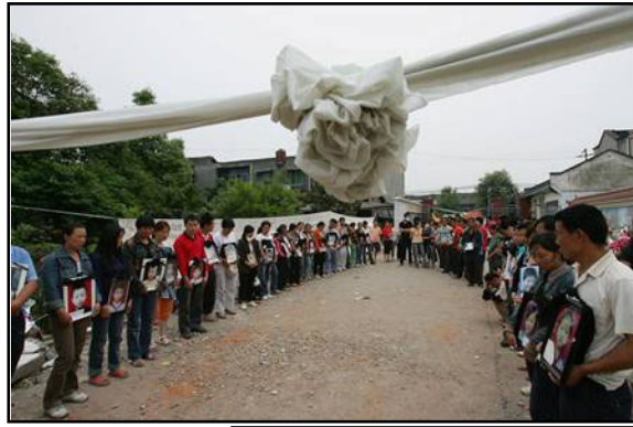
上：地震死难学童父母请愿惩罚“豆腐渣工程”责任人