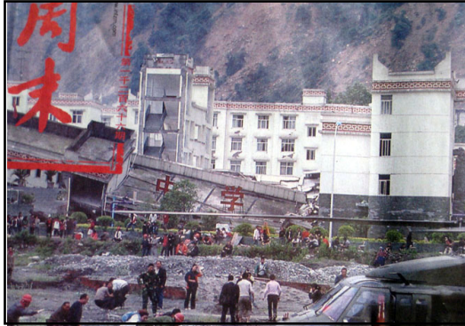
右：倒塌的中学后面露出了坚固豪华的办公楼