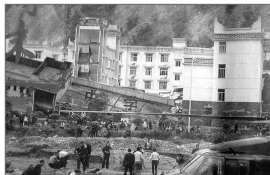
倒塌的中学后面露出坚固豪华的办公楼

⇒ 近半学生死，校舍多倒塌。拿起水泥块，一擦碎哗啦。偷工又减料，如同豆腐渣。政府办公楼，坚固又豪华。