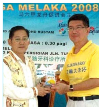
▲主办方给参赛的法轮功学员代表（右）颁奖

【明慧网】马来西亚“马六甲龙舟金杯锦标赛”于二零零八年六月一日在马六甲河畔举行，当地法轮功学员组成女子队和男子队参加了这项传统文化活动，并分别获得精神奖和纪念奖。主办单位特别安排新加坡法轮功学员组成的腰鼓队表演中华传统腰鼓舞，令龙舟赛更添欢乐气氛。