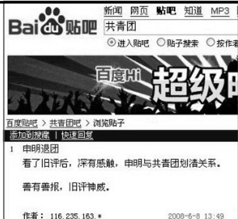
百度贴吧退团声明网络截图

“暴力斗争”这一中共的邪恶特征已被越来越多的人唾弃，中共在历次政治斗争中迫害死了八千万中国人，比两次世界大战死亡人数都多，祸害神州涂炭生灵。可能有的朋友觉的那都是过去的事情了，殊不知现在中共迫害百姓的方式更加隐蔽恶毒，自从1999年迫害法轮