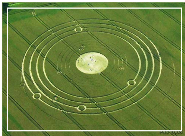
2008年7月15日，英国威尔特郡的埃夫伯里庄园出现的神秘麦田圈指向2012年冬至。

古今很多预言也提示我们从现在到2012年，人类各种灾祸会不断，甚至会有淘汰人的大灾难出现。而出现这些灾难的淘汰过程当然也是预言中“净化”的一种体现，另一方面这种“净化”也包括对地球整体环境以及人类社会一切不正的、败坏的、变异的邪恶因素的清除，包括许多我们肉眼看不到的败物和邪灵。