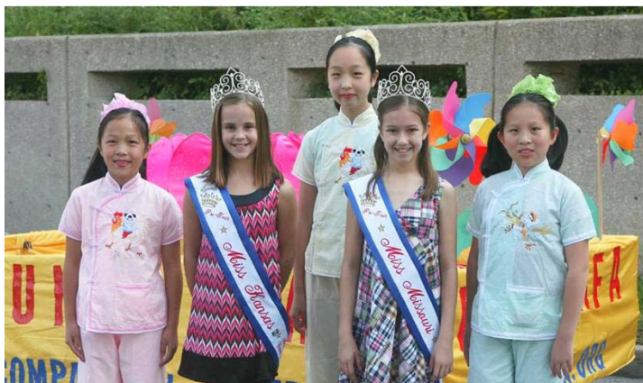
两位密苏里小姐与大法小弟子在花车前留影