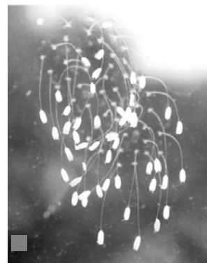
青岛某公司玻璃上开出的优昙婆罗花

2008年10月4日，新华网罕见的转载了《青岛日报》的一篇报道，题目是《窗户玻璃长出“花”》。文中说，10月3日上午，青岛早报记者来到城阳大北曲西村的一家企业，在公司二楼办公室东侧的玻璃上看到了这些白色小花。雪白的花朵直径约有1毫米，花形如钟，淡白色，花茎细如金丝，共有47朵。仔细看，47朵小花的花径与玻璃直接连在一起，既没有扎根泥土，玻璃下面也没有裂痕。公司员工说，刚开始发现这些小花时，不知道是什么东西，还以为玻璃不干净，差点用抹布擦掉。公司一名经理看过后说，这可能是传说中的『优昙婆罗花』。该记者在网上搜索发现，很多地方也出现过类似的花。这家公司玻璃上的小白花，与网上流传的“优昙婆罗花”图片比较，在形态、颜色等方面都非常相似。