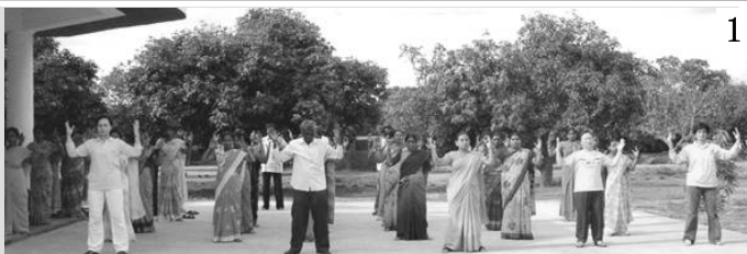
图1、2/印度学校 Byreshawara 全校师生在体育课上练习法轮功。