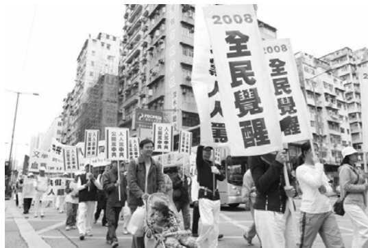
香港声援三千万人退党游行