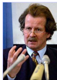
联合国酷刑问题专员诺瓦克多次向联合国酷刑委员会提出法轮功学员被活摘器官的指证

十一月七日，联合国反酷刑委员会的专家对中国执行《禁止酷刑公约》的情况进行质询。在发现作为缔约国的中国未能履行公约中的条款后，反酷刑委员会十一月二十一日命令中共对法轮功学员器官被活摘的指控和这场对法轮功迫害的责任人进行调查。◇