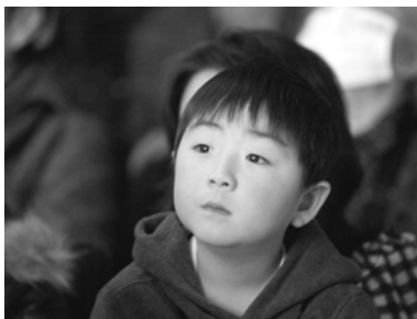
■ 红尘中疲惫的心被洗净后也许就是这种纯净的感觉