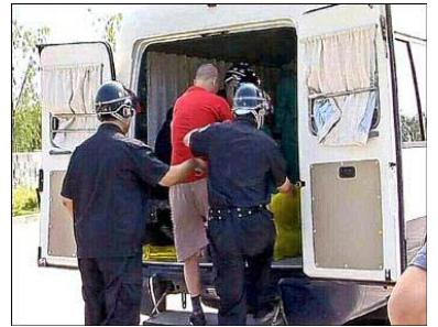
中共使用的死刑执行车外观与一般警用厢型车无异。

古云：“天理昭昭，善恶有报”。二战后德国纽伦堡大审判，杀人刽子手都难逃法网。同样，对无辜法轮功学员的残酷迫害，这批丧心病狂的加害者，最后都将在正义的谴责、审判与严惩中偿还罪恶。德国纳粹集中营打手的下场，也将是那些执行活摘器官者的下场。◇