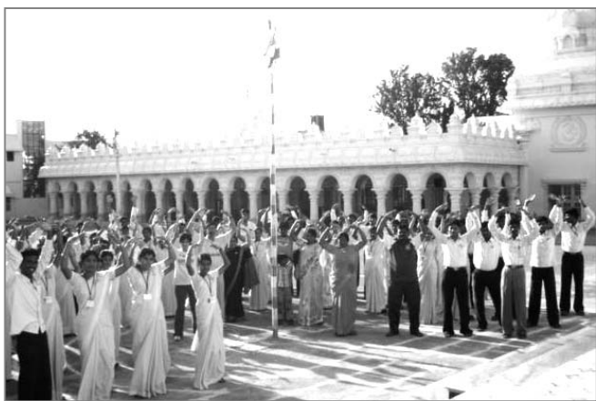
■ 人们在印度班加罗尔的一所学校学炼法轮功

五月十三日早晨，印度知名大报《印度快报》的记者，专程来到印度修炼法轮功人数最多的地区班加罗尔，采访法轮功学员。当天正是庆祝法轮大法洪传十七周年的“世界法轮大法日”。法轮大法九二年从中国传出，至今已洪传一百一十四个国家和地区。