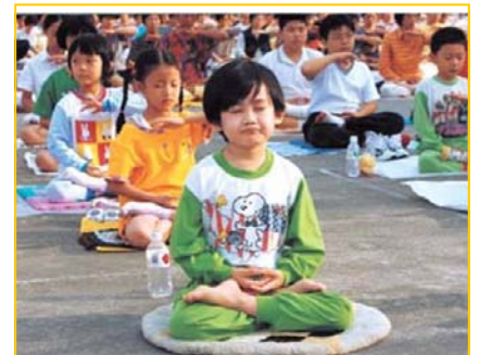
■ 1998 年法轮功小弟子在广州的修炼心得交流会上集体炼功。他们一起交流如何按照“真善忍”做一个好孩子。