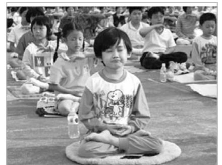
■ 1998 年法轮功小弟子在广州的修炼心得交流会上集体炼功。他们一起交流如何按照“真善忍”做一个好孩子。

腥风血雨中，多少家庭深陷苦难、多少孩子失去了父母的关爱。如果六月一日是“儿童节”，那么就用此文为所有还在苦难中的法轮功学员的孩子及他们正在遭受迫害的父母呼吁吧：快快停止迫害，还孩子们幸福童年，温暖的家！◇