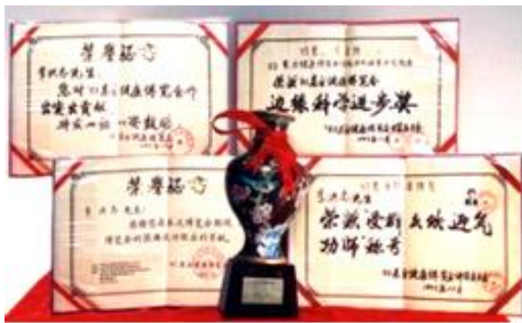
2003 年李洪志老师参加 会获得奖杯和奖状

一九九三年春天，师父来武汉传法，当时是在中央部级科研单位的礼堂举办的学习班。有一件事我终身难忘。当时办班一期是十天，师父每天要用一个半小时以上为大家讲法，然后再教练功动作。在学习班开始后的一天，有一个年约 40 多岁、瘦高个的男子，因没有学习班的听课证非要进去不可，被工作人员拦下，并向他说明要凭听课证才能进去。他不但不听劝阻，反而大吵大闹：我来就是和他（指师父）斗法的，我的师父 100 多岁了，他这么年轻……这男子说了很多不好的话。后来这事被师父知道了，叫工作人员放他进来。等师父的讲课授完，他很安静地走了，并特意找到工作人员说：“我再也不闹了。这才是真正的师父。”（文／中国大陆大法弟子）◇