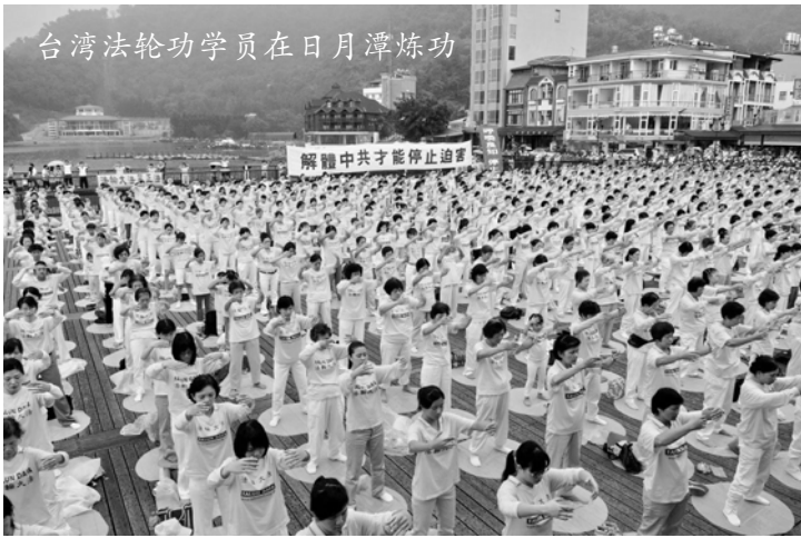
台湾法轮功学员在日月潭炼功