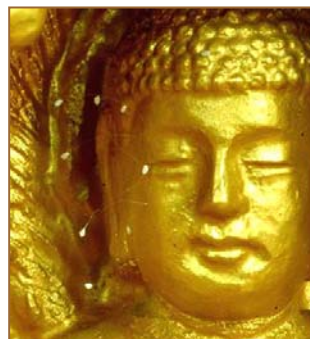
上图：美国纽约，苹果上的优昙婆罗花。