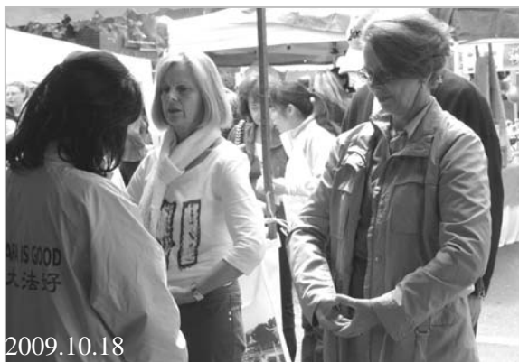
■ 悉尼法轮功学员参加克洛斯特集市 学功者众

我这个人按说各方面条件还可以，可就是有点儿不自信。在公司里也是这样，总是觉得自己做得不够好。但作为一名法轮功修炼者，我平时更多的是想如何不伤害别人，是否符合真善忍的要求。