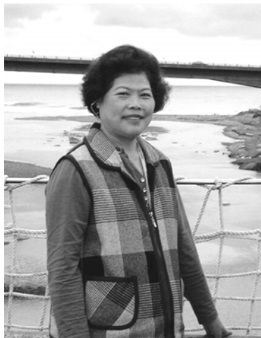
■ 修炼中，困扰春莺三十多年的皮肤过敏出疹发痒，竟然在不知不觉中好了！