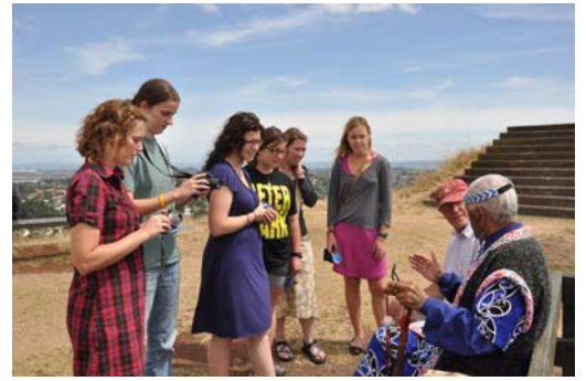
■游客们人手一份法轮功传单与酋长交谈

客。人们一到山顶，就被酋长特有的服饰所吸引，当得知酋长上山为了声援法轮大法，更是充满了兴趣，几乎每个人都拿了一份法轮大法真相传单。很多人和酋长愉快交谈并合影留念；中国大陆的游客们纷纷把报纸和光碟藏进书包，其中三人当即退党。◇