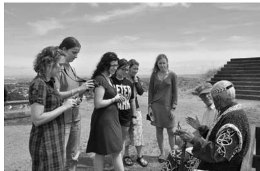
■游客们人手一份法轮功传单与酋长交谈

客。人们一到山顶，就被酋长特有的服饰所吸引，当得知酋长上山为了声援法轮大法，更是充满了兴趣，几乎每个人都拿了一份法轮大法真相传单。很多人和酋长愉快交谈并合影留念；中国大陆的游客们纷纷把报纸和光碟藏进书包，其中三人当即退党。◇