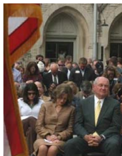
■ 普度夫妇在祈雨仪式上虔诚祷告

近年来大陆各种天灾人祸层出不穷，这已经是上天对中共的谴责。而很多中外预言都提到，天灭中共时会有一场更大的灾难来临。如何才能平安度过劫难？如今已经有超过 6800 万的中国同胞做出了理智的选择——退出中共党、团、队组织，废除了把生命献给中共的毒誓。生命极其珍贵，机缘也许只有一次，在中共气数将尽之际，希望同胞们都能顺应天意，远离灾难，选择平安。◇