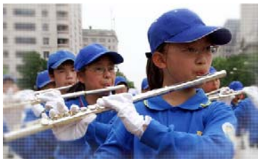
■ 有卉用业余时间刻苦练习演奏，为了用长笛告诉人们“法轮大法好”。

李老师更提到“打不还手，骂不还口”的道理，我从理解到高尚的道德标准内涵，书中每篇文章不但告诉我们做人的道理，也让我在日常生活中，不管是在家里、还是学校都有帮助。每当在学校和同学发生矛盾时，我就想到书中的话，就此勉励自己，平稳自己的情绪，这本书让我从爱发脾气的小女生，变得更温柔、懂事、体贴，让我每天快乐的学习，和人和平相处，真是一本值得更多人阅读的好书！（文 / 张子涵）◇