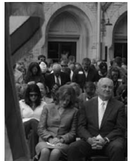
■ 普度夫妇在祈雨仪式上虔诚祷告

近年来大陆各种天灾人祸层出不穷，这已经是上天对中共的谴责。而很多中外预言都提到，天灭中共时会有一场更大的灾难来临。如何才能平安度过劫难？如今已经有超过 6800 万的中国同胞做出了理智的选择——退出中共党、团、队组织，废除了把生命献给中共的毒誓。生命极其珍贵，机缘也许只有一次，在中共气数将尽之际，希望同胞们都能顺应天意，远离灾难，选择平安。◇