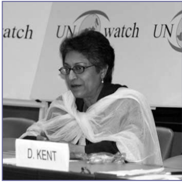
■ 联合国“宗教信仰自由” 特派专员阿斯玛·贾汉吉尔

【明慧网】联合国“宗教信仰自由”特派专员阿斯玛·贾汉吉尔（Asma Jahangir）在她离任前的最后一份关于中国部份的报告中重申：“一种宗教的内容应由信教徒自己来界定。”