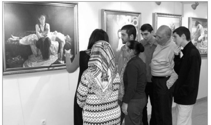
■ 观者们在专注聆听画作的详细解说

画展赢得不同阶层民众的高度评价，很多参观者久久不愿离开，有的观众在作品前潸然泪下。很多人表示，作品给他们留下了深刻的印象。人们在赞美法轮大法的同时，也谴责中共的暴行，表达对法轮大法（又称法轮功）的支持与同情，希望能尽早结束迫害。◇