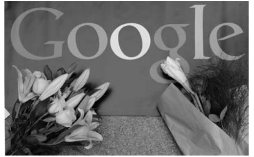
图：2010 年 1 月 14 日，民众向谷歌献花，表达对谷歌不向中共叩首的支持。

可以看出，这些年中共封网封得最厉害的，就是法轮功真相。很明显，修炼“真善忍”的法轮功学员对哪个社会都是有百利而