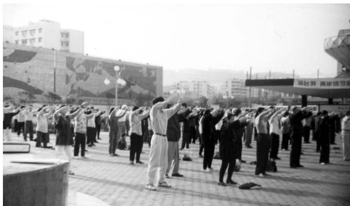
■ 1998 年重庆法轮功学员周末集体炼功

警察要老人签字画押，保证不炼功，老人坚决拒绝，遭到几个五大三粗的警察毒打。恶警将老人强行带至永兴派出所，不经任何审讯就非法关押老人，对一个没有