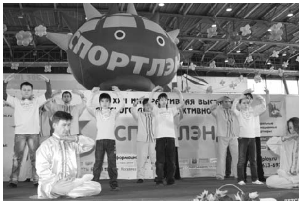
■ 莫斯科“第二十二届儿童体育王国博览会”上的法轮功功法演示

法轮功学员参加了博览会, 介绍和表演法轮功功法, 教小朋友们叠纸莲花。俄罗斯法轮大法中心因积极参与莫斯科市的社会项目和文体项目, 获得博览会组委会颁发的两项褒奖, 这是法轮功学员第三次在儿童博览会上获奖。◇