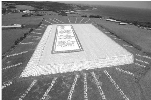
二零零九年五月九日早上，台湾六千余名法轮功学员在南台湾风光明媚的垦丁风景区埔顶大草原，排出指导修炼的《转法轮》这本书

即使是犯人，也可悔过自新而修炼。在中共迫害前，法轮功书籍流传于大陆监狱，其实并不是个别现象。例如：基于法轮功教化犯人的良效，台湾的监狱曾颁发感谢状给法轮功学员。当今，法轮功弘传世界一百多个国家和地区，获褒奖数千份。“人类需要真、善、忍，法轮功属于全世界”已成共识和事实。（文/陆文）◇