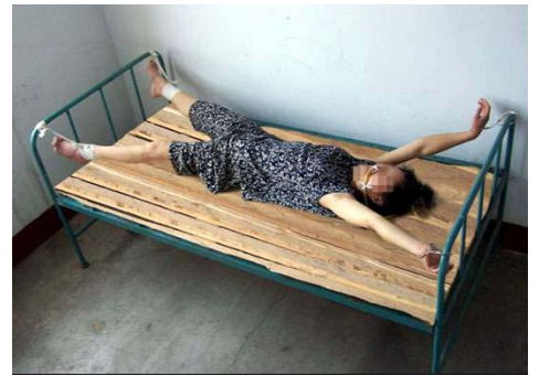
酷刑演示图——死人床

狱警除了给法轮功学员上束缚刑外,还使用更恶毒的一种酷刑,他们把中间的床板拿掉,只留两头各两块板,把手脚吊起来,上身后背垫在床板的棱上,下面小腿垫在棱上,这种酷刑每一分钟都很难熬。狱警为遮掩他们的恶行,常常在晚上实施酷刑,受刑者前半夜还清醒,后来就会被折磨得神志不清了。