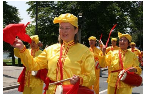
德国法轮功学员组成的腰鼓队

不少观众表示，以前曾听说过法轮功，今天更深地感受到法轮功学员的善良正义，更详细地了解到这场迫害的残酷，同时也增添了对法轮功和其修炼者们的敬意。◇