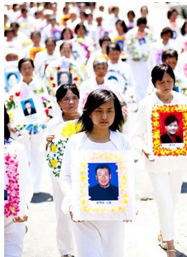
■ 游行中“悼念被中共迫害致死的法轮功学员”方阵