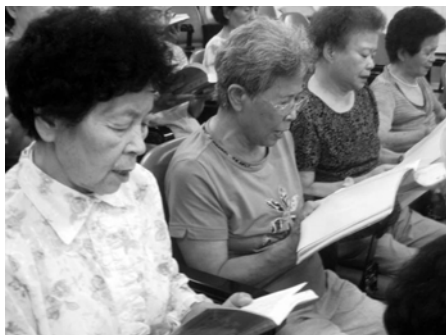
图: 在朗朗读书声中, 台湾老人乐以忘忧

七月二十八日, 明慧网上有两篇文章报道了两岸老人生活中的故事。关于台湾老人生活的文章叫《老当益壮的读书会》。读书会就是修炼者在一起学法轮功书籍, 有三、四十名老年人在每周日的下午来读书。他们平均年龄七十多岁, 最大的八十几岁。