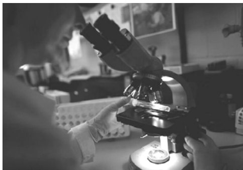
图：科学家们在显微镜下观察病毒