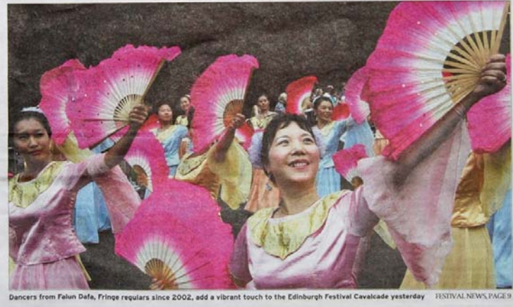
Fan fare: Chinese light up Cavalcade