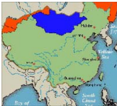
■ 橙色部份为江泽民出卖中国的土地范围

共产党在攫取政权之后，为了权力的“稳定”，为了拉拢人心称霸一方，曾经多次割让国土给周边的小国，包括巴基斯坦、缅甸、尼泊尔、北朝鲜、越南、印度，等等；