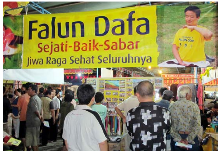
■ 民众在展板前了解法轮功真相

（明慧记者印尼报道）为纪念郑和下西洋六百零五周年，二零一零年八月五日至七日，印尼中爪哇三宝龙地区举办了一年一度的传统纪念活动。法轮功学员设立展位参加活动，受到民众的热烈欢迎。