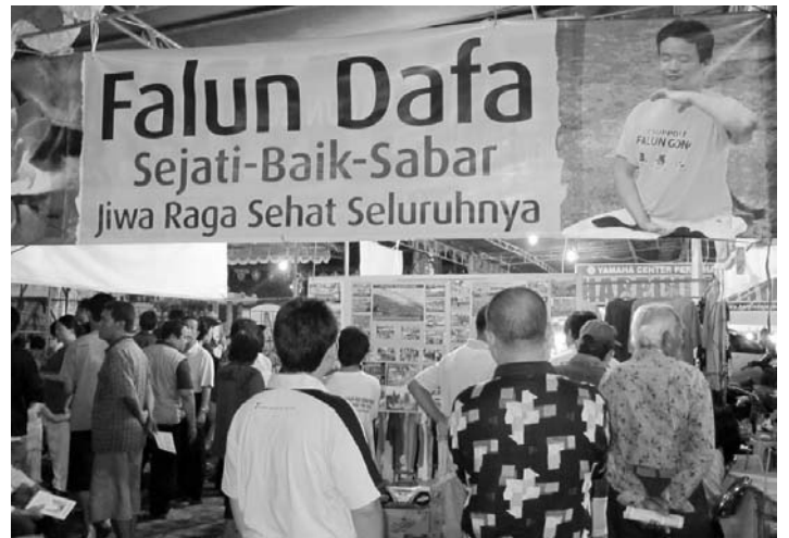
■ 民众在展板前了解法轮功真相

（明慧记者印尼报道）为纪念郑和下西洋六百零五周年，二零一零年八月五日至七日，印尼中爪哇三宝龙地区举办了一年一度的传统纪念活动。法轮功学员设立展位参加活动，受到民众的热烈欢迎。