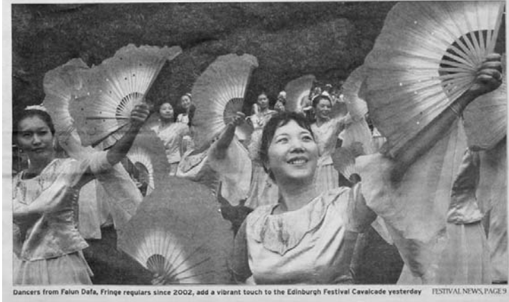
Fan fare: Chinese light up Cavalcade