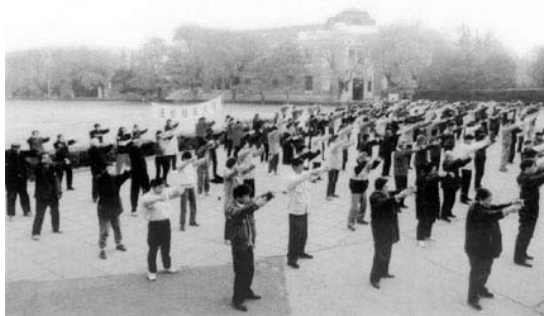
■迫害前，清华大学的法轮功学员在清华学堂前炼功。