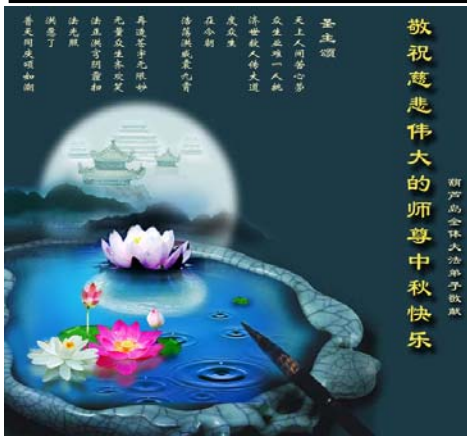
图：大陆法轮功学员 2010 年中秋节以贺卡表达对李洪志师父的问候和感恩