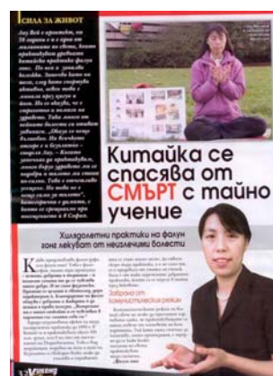
图:《女士周末》发表专访法轮功学员的文章

党员的人 数。法轮 功没有人 员名单, 所以很难 统计世界 上一共有 多少人修 炼。“法 轮功既不 是宗教, 也不是政 治。”刘