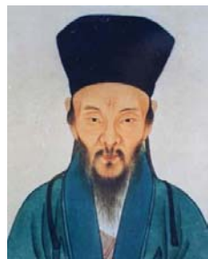
图：明朝思想家、教育家王阳明

不久，王华果然状元及第，后官至吏部尚书，娶妻郑氏，夫唱妇随。王阳明出生时，他的祖母曾梦见屋上仙乐齐鸣，旗幡招展，一群仙人驾着祥云送一小孩儿来家，并听到一天神高叫：“贵人来也”，随后仙人们驾起彩云而去。他的祖母忽然惊醒并听到了啼哭声，这时侍女报郑夫人已产