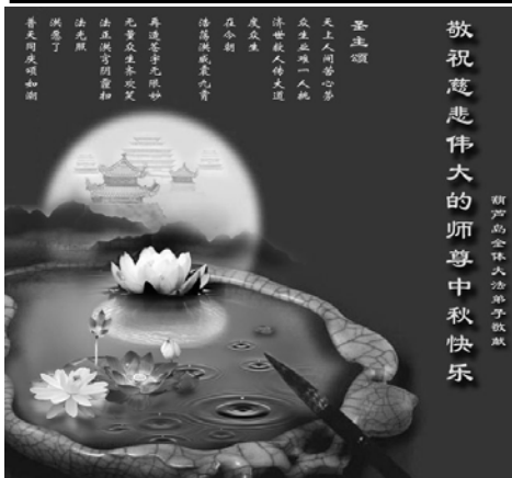
图：大陆法轮功学员 2010 年中秋节以贺卡表达对李洪志师父的问候和感恩