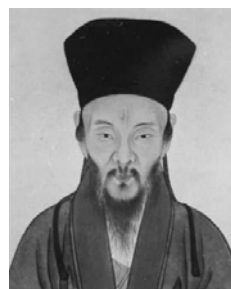
图：明朝思想家、教育家王阳明

不久，王华果然状元及第，后官至吏部尚书，娶妻郑氏，夫唱妇随。王阳明出生时，他的祖母曾梦见屋上仙乐齐鸣，旗幡招展，一群仙人驾着祥云送一小孩儿来家，并听到一天神高叫：“贵人来也”，随后仙人们驾起彩云而去。他的祖母忽然惊醒并听到了啼哭声，这时侍女报郑夫人已产