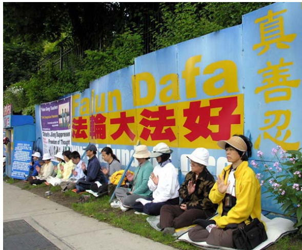
■ 温哥华法轮功学员在中领馆前抗议中共迫害已持续九年

中共对法轮功的残酷迫害已经持续十多年了，而且还在进行中。但是无论在中国，还是在世界上，了解法轮功的人们都由衷地对法轮功修炼者的行为表示认同。这说明什么？美好是不分国界的，“真善忍”经过法轮功修炼者的努力，已经成为普世的价值而呈现在世界人民的面前。世人对“真善忍”的认同就是对迫害的否定，就是对法轮大法的赞颂！（文/云外）◇