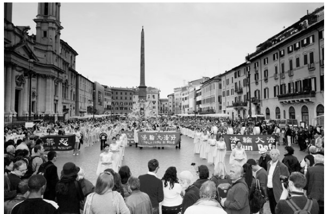
上：欧洲天国乐团经过维克多伊曼纽尔二世纪纪念碑 下：法轮功游行队伍在四河喷泉广场受关注