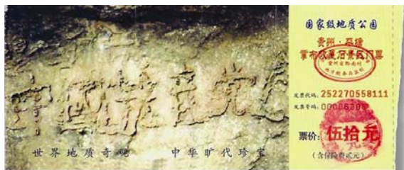
图：位于贵州省平塘县掌布风景区内的救星石景区的“藏字石”，石头上清晰可见的六个字是：中国共产党亡（此图为风景区门票）。

【明慧网】孔子是我国春秋时期的思想家、教育家，非常重视道德教化，善于从普通的事物或者现象中发现隐含其中的道理，善化他人。他通过对最平常的水的观察、感悟和思考，以伦理道德思想为切入点，来阐发对水的深刻理解和认识，给人以智慧的启迪。