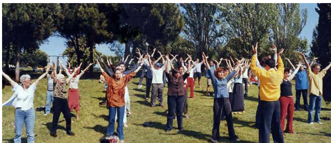
左图：在西班牙全国健康博览会上，一批又一批的参观者在室外学习法轮功。

在西班牙连续三年（2001—2003）的全国健康博览会上，法轮功都成为最受瞩目的明星。博览会主办者说：“法轮大法快成了博览会的专场展示会了。法轮大法是唯一享有可以在室外展示这一特权的参展者。”博览会期间，西班牙国家电台、巴塞罗那电