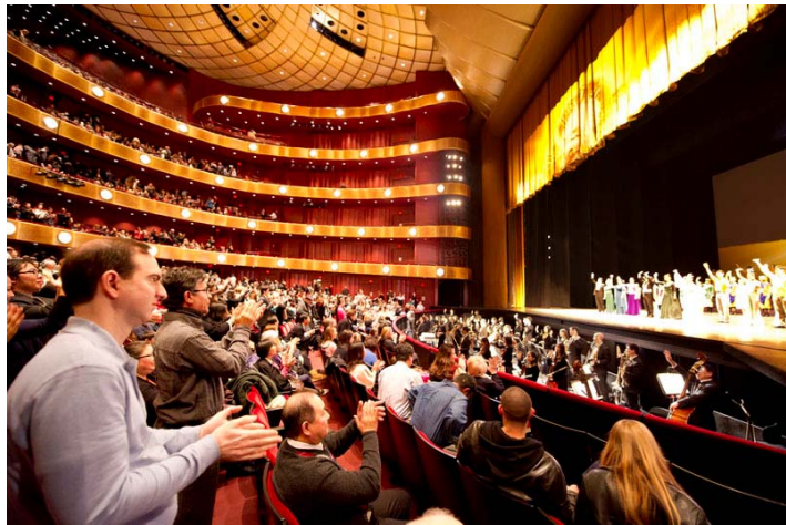
图：2011 年 1 月 16 日下午，神韵纽约艺术团在美国林肯中心大卫寇克剧院的第十场演出落幕。