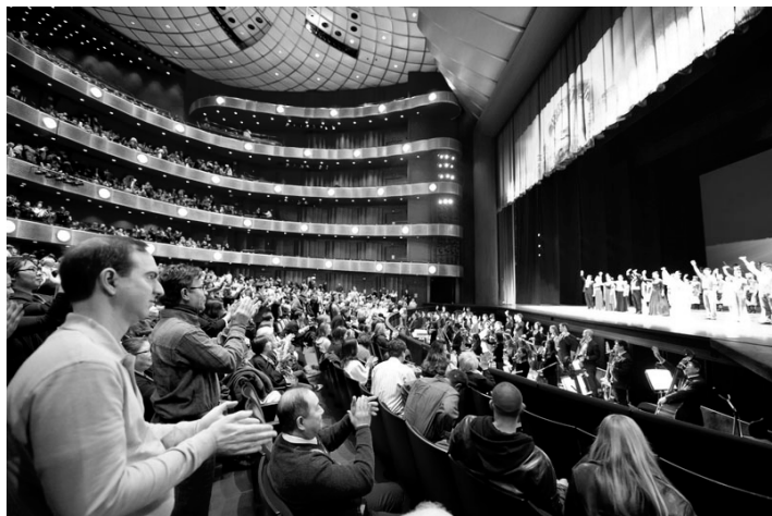
图：2011 年 1 月 16 日下午，神韵纽约艺术团在美国林肯中心大卫寇克剧院的第十场演出落幕。