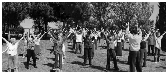
左图：在西班牙全国健康博览会上，一批又一批的参观者在室外学习法轮功。

在西班牙连续三年（2001—2003）的全国健康博览会上，法轮功都成为最受瞩目的明星。博览会主办者说：“法轮大法快成了博览会的专场展示会了。法轮大法是唯一享有可以在室外展示这一特权的参展者。”博览会期间，西班牙国家电台、巴塞罗那电