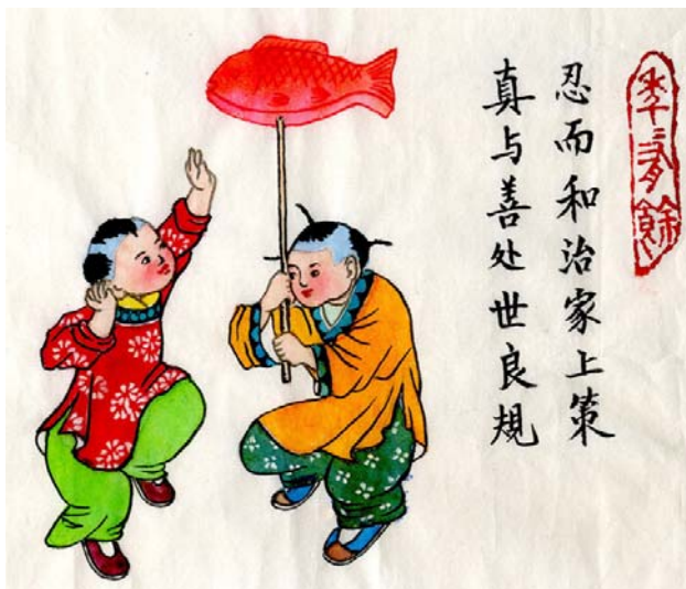
对联：真与善处世良规，忍而和治家上策 横批：年年有余